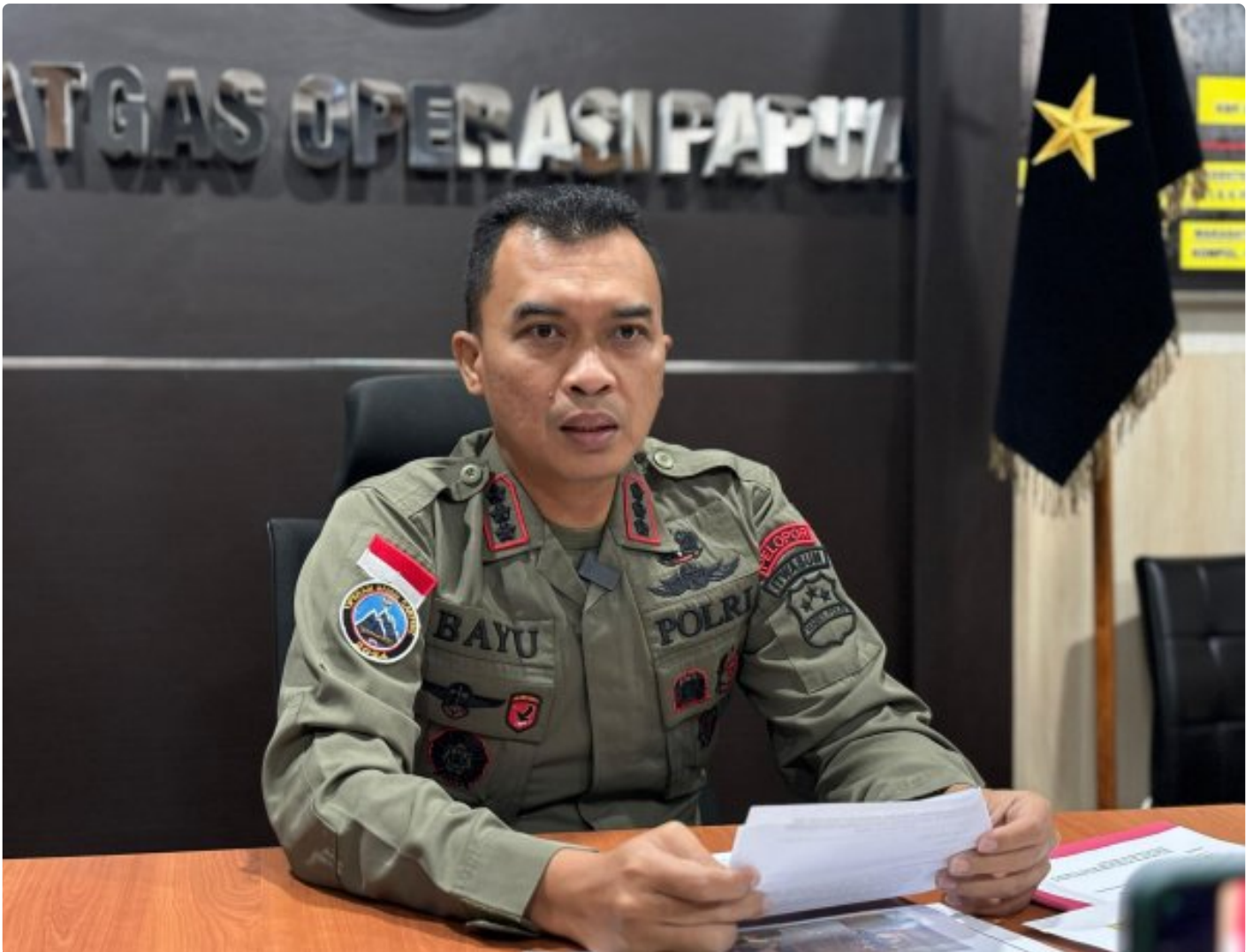
Bhayangkara - Humas Polres Maros

Mimika- Satgas Ops Damai Cartenz-2024 kembali berhasil menangkap DPO anggota Kelompok Kriminal Bersenjata (KKB) Puncak. Adapun anggota DPO